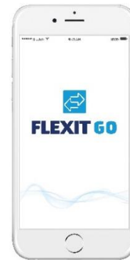
„Flexit GO“ programėlė